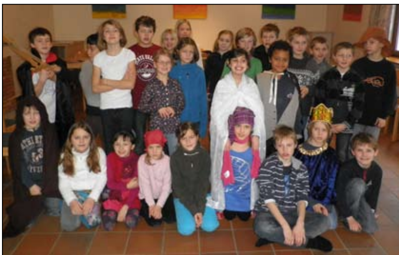
Ein großer Erstkommunionkurs