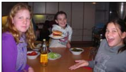
Burger-Kings und -Queens

Ahrensburg/Bargtheide/Großhansdorf Am 16. Dezember trafen sich die drei Messdienergruppen unserer Pfarrei zur gemeinsamen Adventsfeier im Gemeindezentrum Ahrensburg. Bei Kakao und Plätzchen saßen wir gemütlich zusammen. Anschließend bastelten die jüngeren Messdiener Weihnachtsdeko. Die Größeren bereiteten währenddessen in der Küche das „Festmahl“ zu. Es gab selbstgemachte Burger mit Pommes und als krönenden Abschluss Eis!