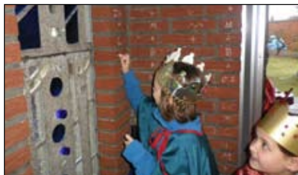
Segen 20*C+M+B+12 an der Kirche

Ahrensburg/Bargteheide/Großhansdorf Am 8. Januar waren 12 Sternsinger-Gruppen mit insgesamt 48 Kindern schön und bunt verkleidet in unserer Pfarrei unterwegs. Nach fröhlichen Aussendungsgottesdiensten in St. Michael und St. Ma-