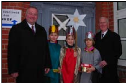
Die Sternsinger bringen den Segen ins Bargteheider Rathaus

rien brachten die Sternsinger ihre Segenswünsche für das Jahr 2012 in viele Häuser, Wohnungen und Senioreneinrichtungen.