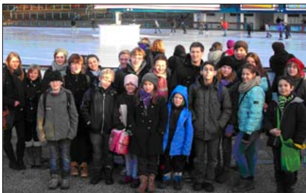
Unsere Messdiener lassen sich nicht aufs Glatteis führen

Ahrensburg/Bargtheide/Großhansdorf Am Freitag, 6. Januar fuhren die neunzehn Messdiener und fünf Begleiter aus den drei Kirchenstandorten zum Schlittschuhlaufen zur Eisbahn „Große Wallanlagen“ in Planzen un Blomen nach Hamburg.