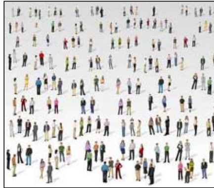
Sind Propheten unter uns?

Wie sieht es heute aus? Manchmal habe ich das Gefühl, wir leben in einer Zeit wie damals Samuel: In diesen Tagen sind Worte des Herrn selten und auch Visionen sind nicht gerade häufig. Dabei liegt doch alles vor uns. Und